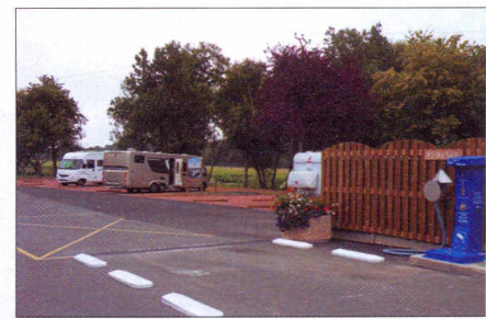
L'accès aux services est impeccable ! Et le stationnement particulièrement plaisant... On aime